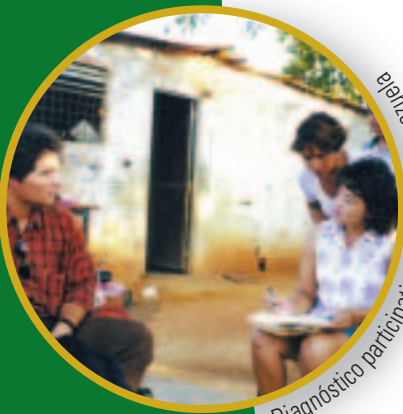
Diagnóstico participativo, Maracáibo