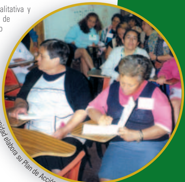
La comunidad elabora su Plan de Acción, Iquitos-Perú