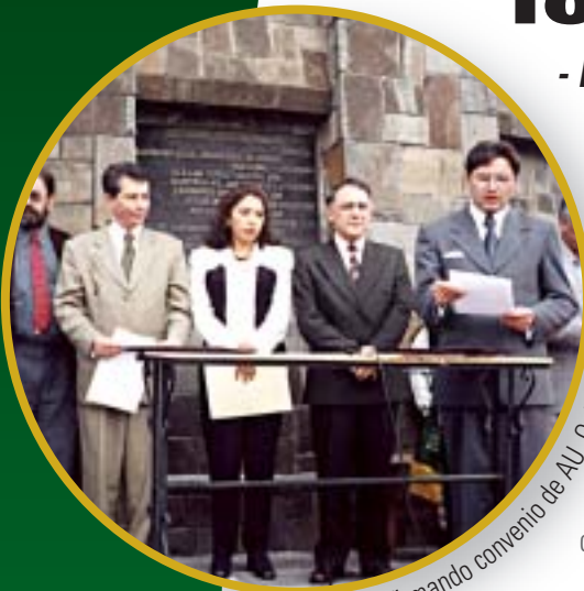
Alcalde firmando convenio de AU, Quito-Ecuador

En Cuenca (Ecuador), se conformó una plataforma multi-actoral para impulsar el Programa Municipal de AU con la participación activa del gobierno local y más de 30 organizaciones de base, ONGs y organismos internacionales. Los actores decidieron, en asambleas y a través de encuestas, el tipo de actividades a desarrollar dentro del Programa generándose compromisos y recursos municipales para su implementación.