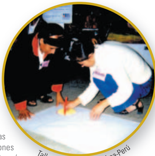
Taller de género y AU, Lima-Perú