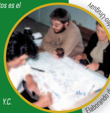
Elaborando diagrama de predicción, Montecito-Uruguay