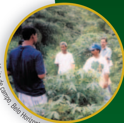
Visita de campo, Belo Horizonte-Brasil

En cuanto a la evaluación cualitativa y cuantitativa de su programa de agro-industrias, el Gobierno Estadual de Mato Grosso do Sul (Brasil) prevé evaluar las condiciones socio-económicas, de género y generacional, el desarrollo local, la transferencia tecnológica y el impacto ambiental a través de encuestas con los/as productores/as y los/as comerciantes.